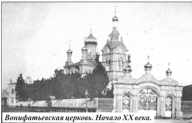
Вонифатьевская церковь. Начало XX века.

В завещании отдельно оговаривались суммы, ко-